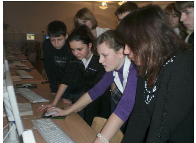
На фото: під час олімпіади